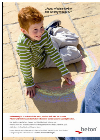
Unendlich viele Möglichkeiten der Gestaltung mit Betonpflaster für Terrasse und Garten.