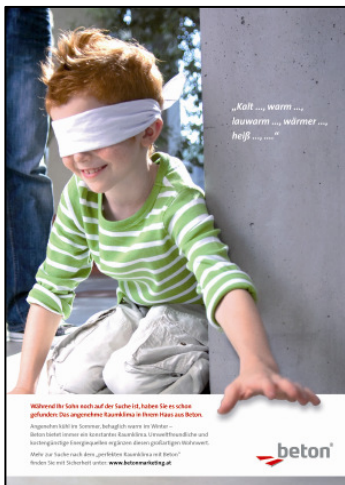
Beton als Energiespeicher, kühl im Sommer und warm im Winter.