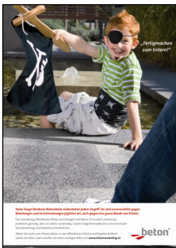
Betonsteine für den öffentlichen Raum. Praktisch, günstig und nachhaltig.