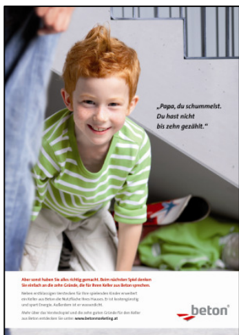
Ein Keller aus Beton spart Energie und bringt mehr Raum.